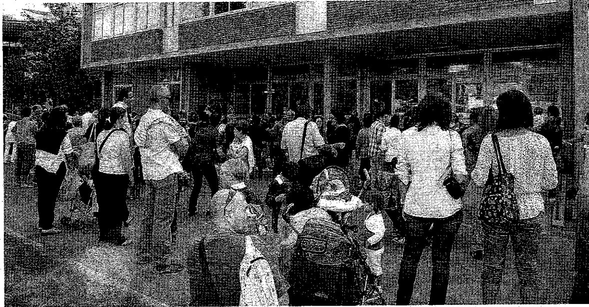
VERSO LA PRIMA CAMPANELLA Rivoluzione nelle scuole del comprensorio del cuoio

RIMANENDO sempre in ambito delle scuole superiori, il dirigente del «Cattaneo» di San Mi-