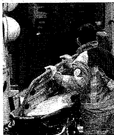
CURE In sei sono finiti in ospedale

poli, soltanto una risiede in un Comune dell'Empolese Valdelsa. Le caratteristiche cliniche degli intossicati intossicate hanno confermato i primi sospetti dei sanitari: intossicazione alimentare da istamina e la responsabilità sarebbe del tonno crudo o poco cotto. I tecnici dell'Asl Toscana Centro si sono recati, anche ieri mattina, nei locali del ristorante dove sarebbero stati consumati i pasti per gli accertamenti igienico-sanitari di rito, relativi anche alle modalità di acquisto e conservazione del pesce. Sono stati, inoltre, prelevati campioni di pesce inviati presso appositi laboratori per la conferma di presenza di istamina e delle sue quantità. L'istamina